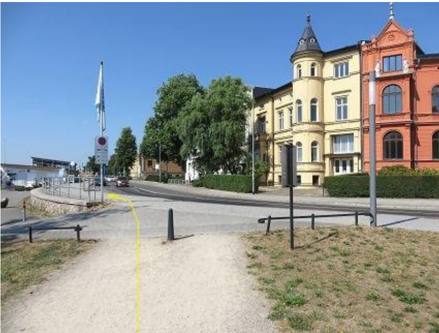
Abbiegung in Werderstraße - zur Schlossbrücke