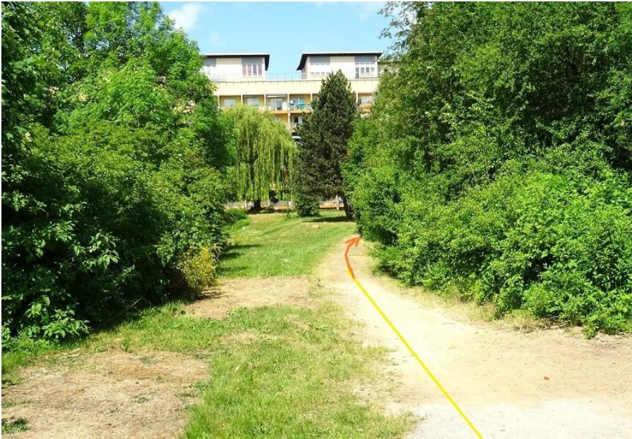
Weiter auf Räthen-Wanderweg zum Räthenweg und nach Zippendorf „Am Strand“