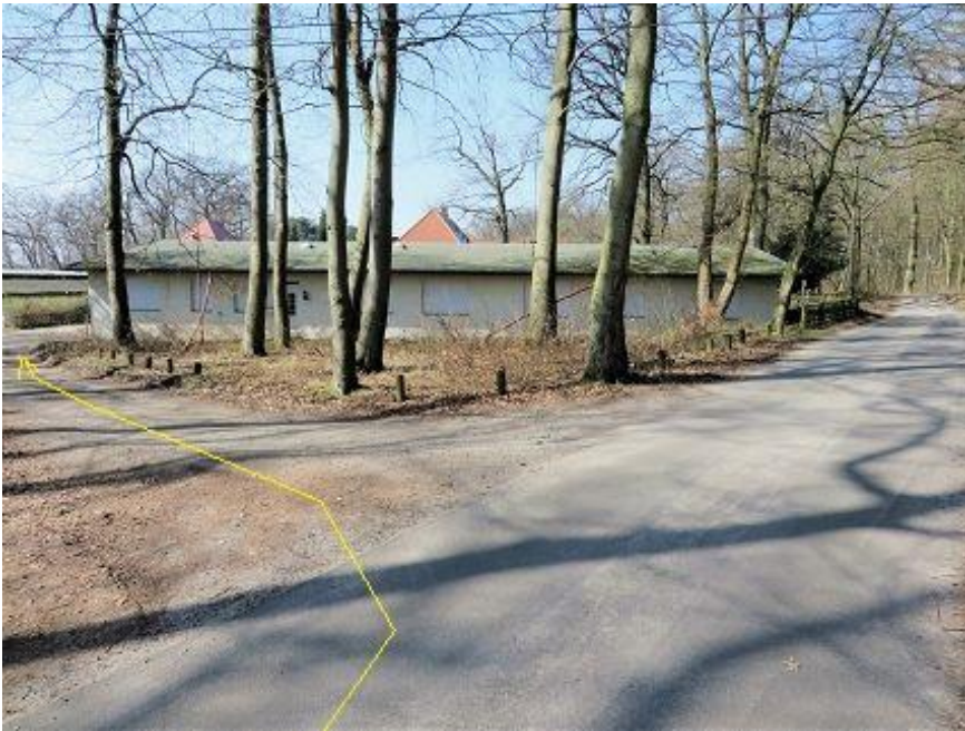
Abzweig vom „Waldschulweg“ zum unteren „Waldschulweg“ (bebaut)