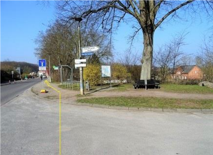
Alte Crivitzer Landstraße - Höhe „Grieche“