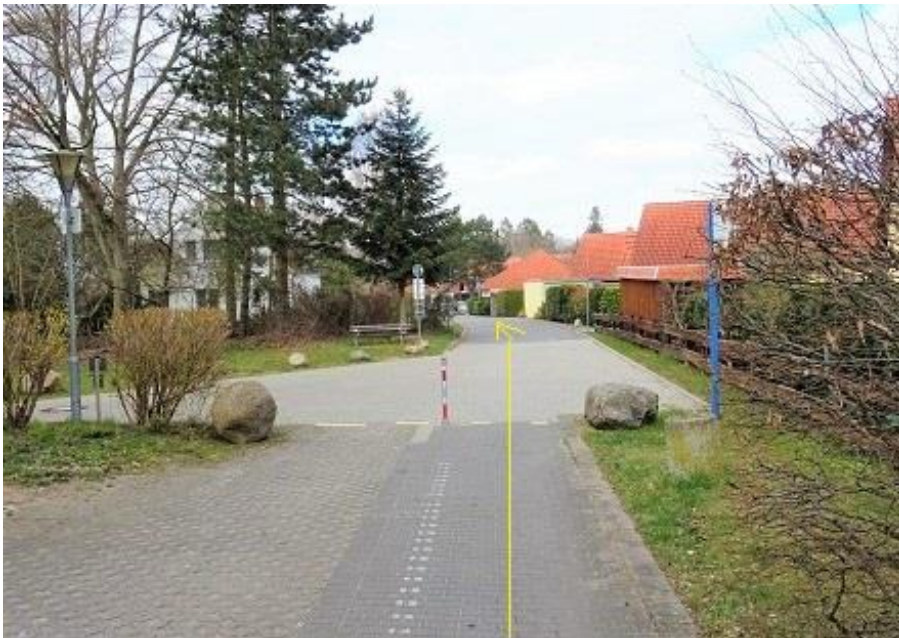
Räthenweg Wendekreis Höhe Rückfront Haus 35/37 MP 13,67 km