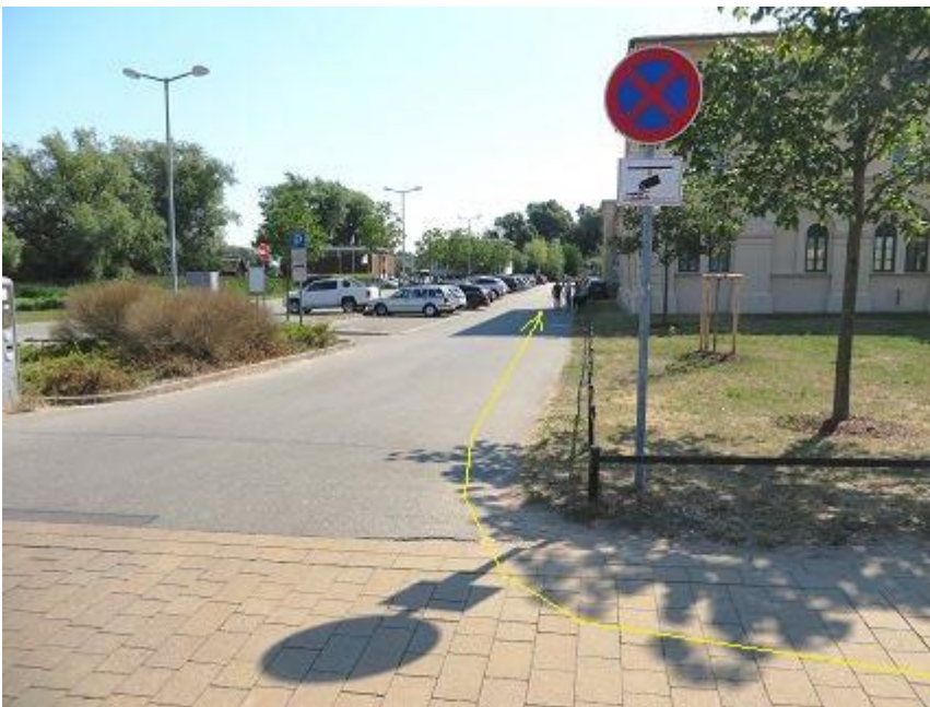
Werderstraße - Abbiegung zur Marstallhalbinsel