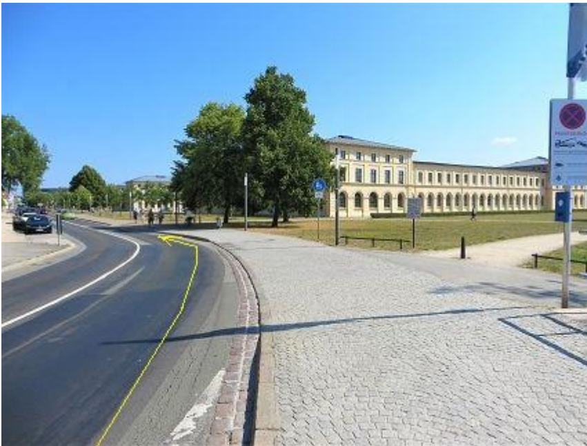
Werderstraße - rechts Marstallgebäude