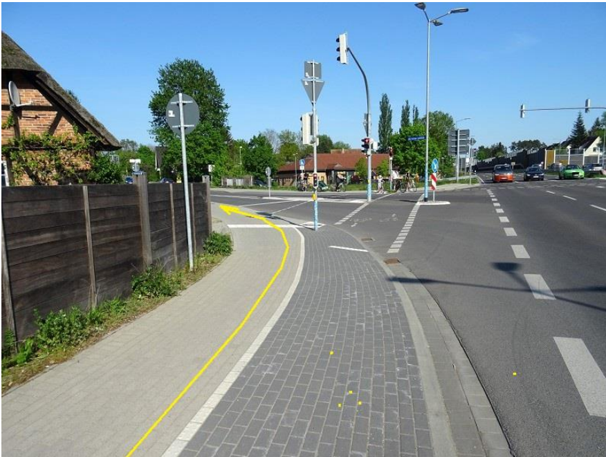
B 321 Geh- / Radweg