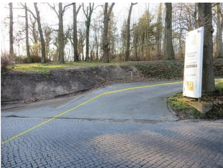
Auffahrt zum Restaurant „Radeberger“-