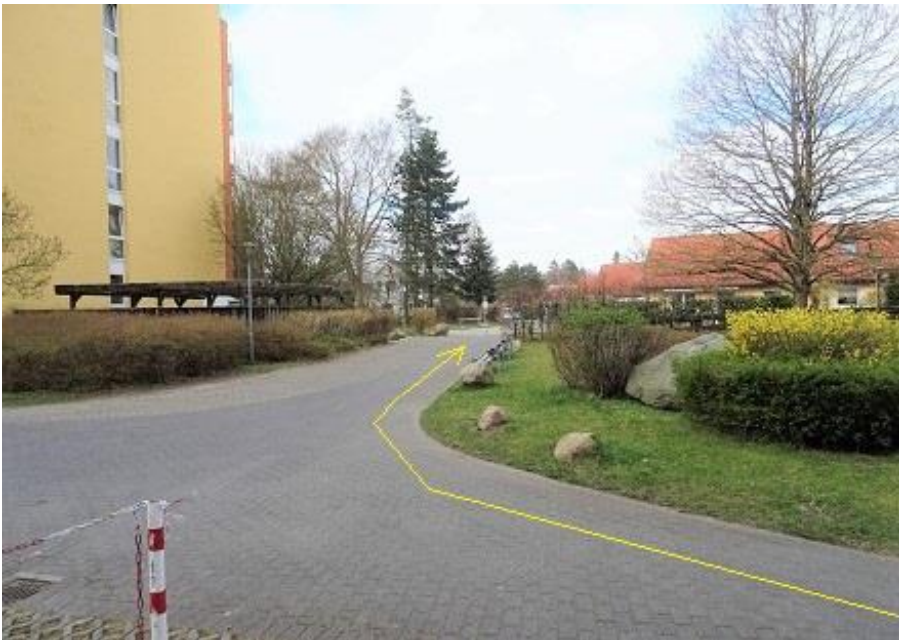
Räthenweg - Rechtseinbiegung In Richtung „Am Strand“