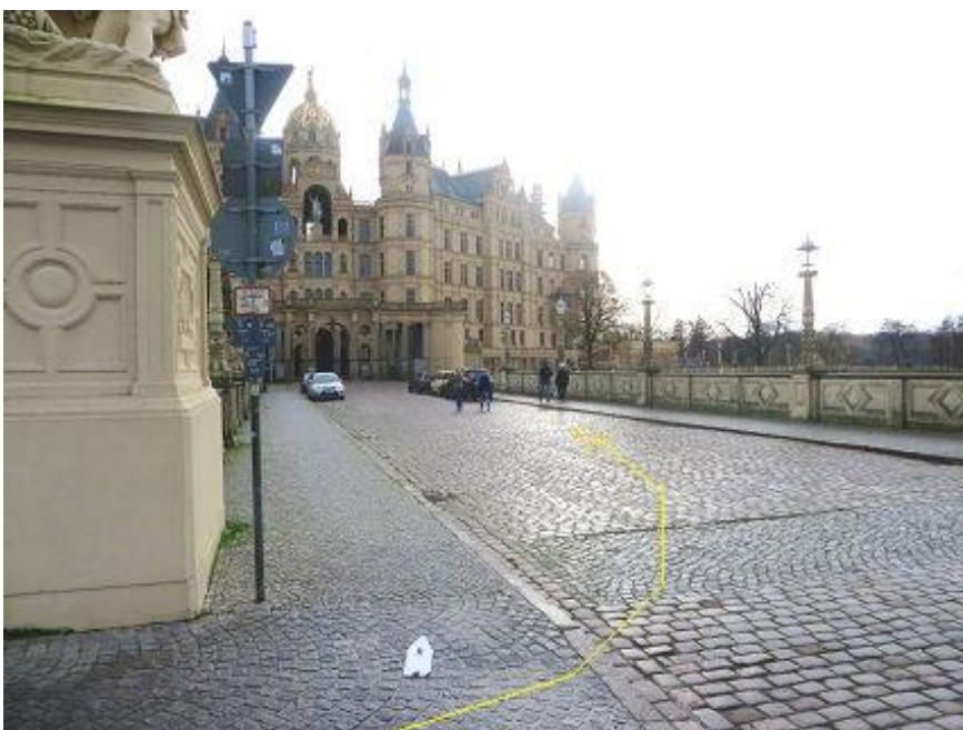
Von Werderstraße - auf Brücke zur Schlossinsel