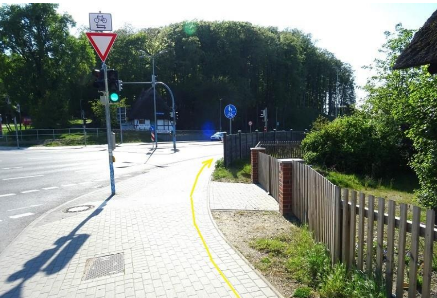
Einbiegung von Alte Crivitzer Landstraße auf Gehweg B 321