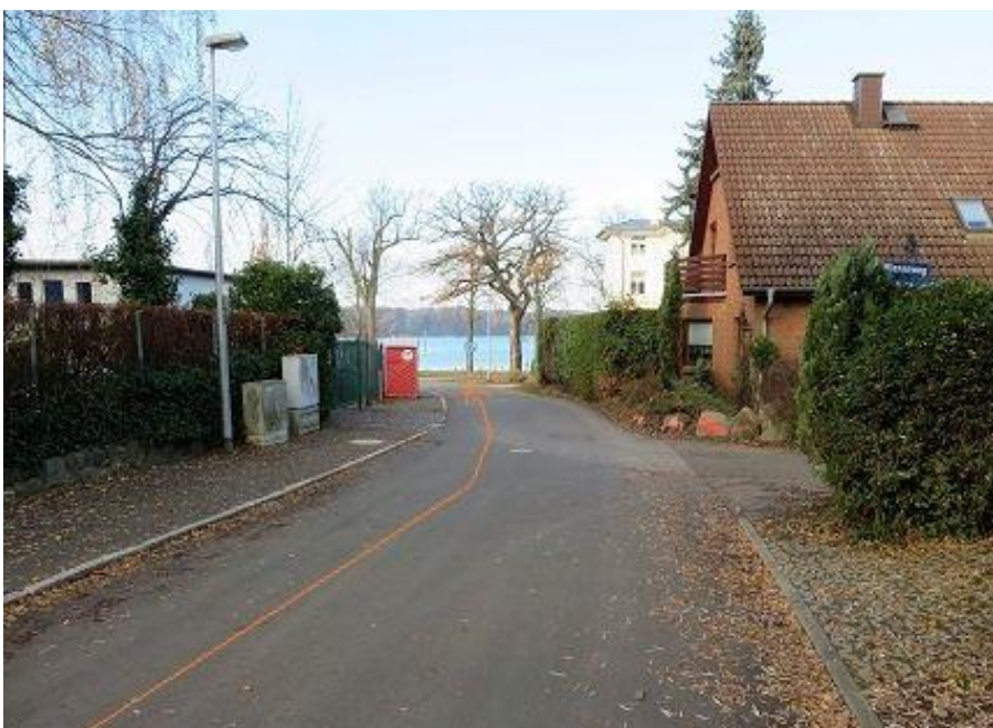
Räthenweg ⇒ „Am Strand“