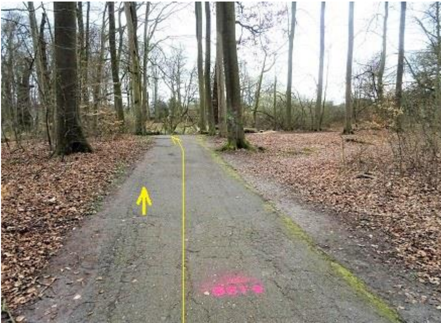
Burg - Asphaltweg