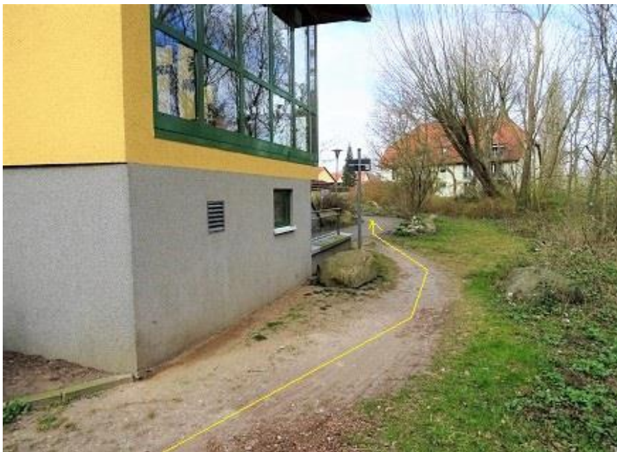
Giebelseite Haus 41